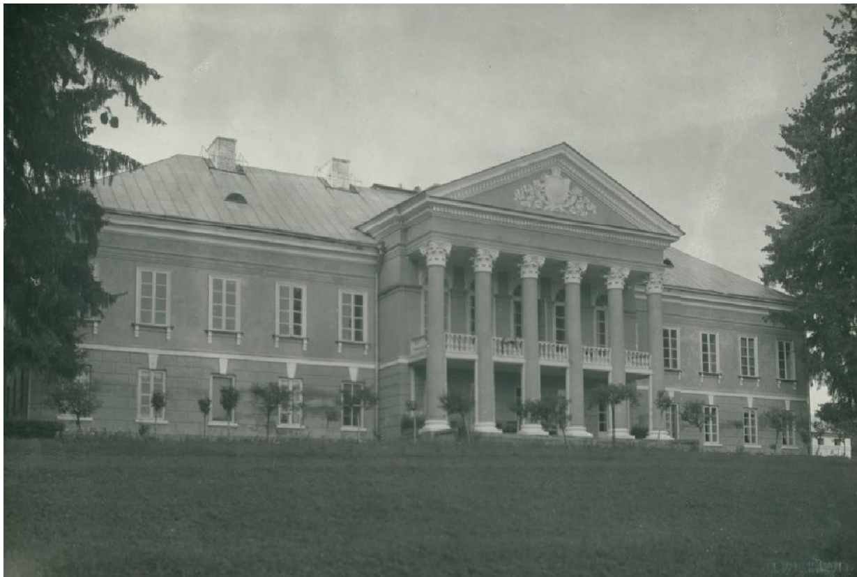
Межиріч Корецький, палац Яна Казімежа Стецького. 1934 р. 47

Великі Межирічі (пол. Międzyrzec Korecki) — село у Рівненському районі, центр Великомежиріцької сільської громади. Назва пішла від розташування села між річками («межи річок»). До 1965 року мало назву Межиріч і Межирічі, а за польського правління — Межиріч Корецький.