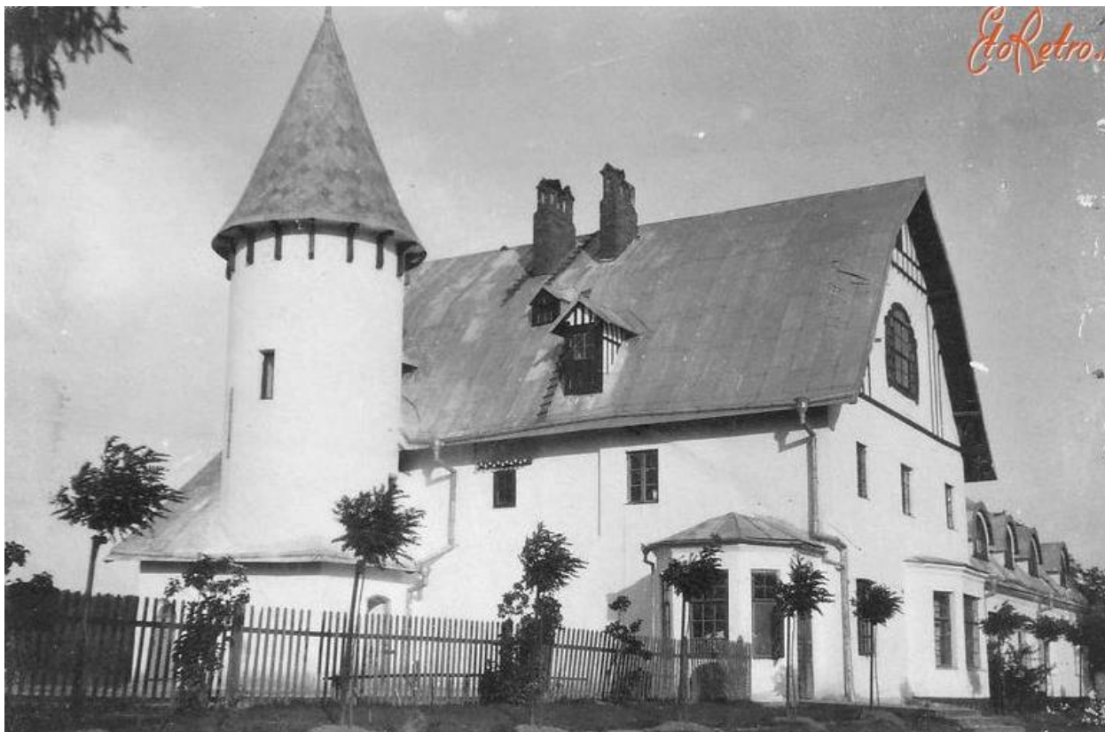
Гоща, садиба Іпохорських-Ленкевичів (Валевських). 53

Гоща — центр Гощанської селищної територіальної громади Рівненського району.