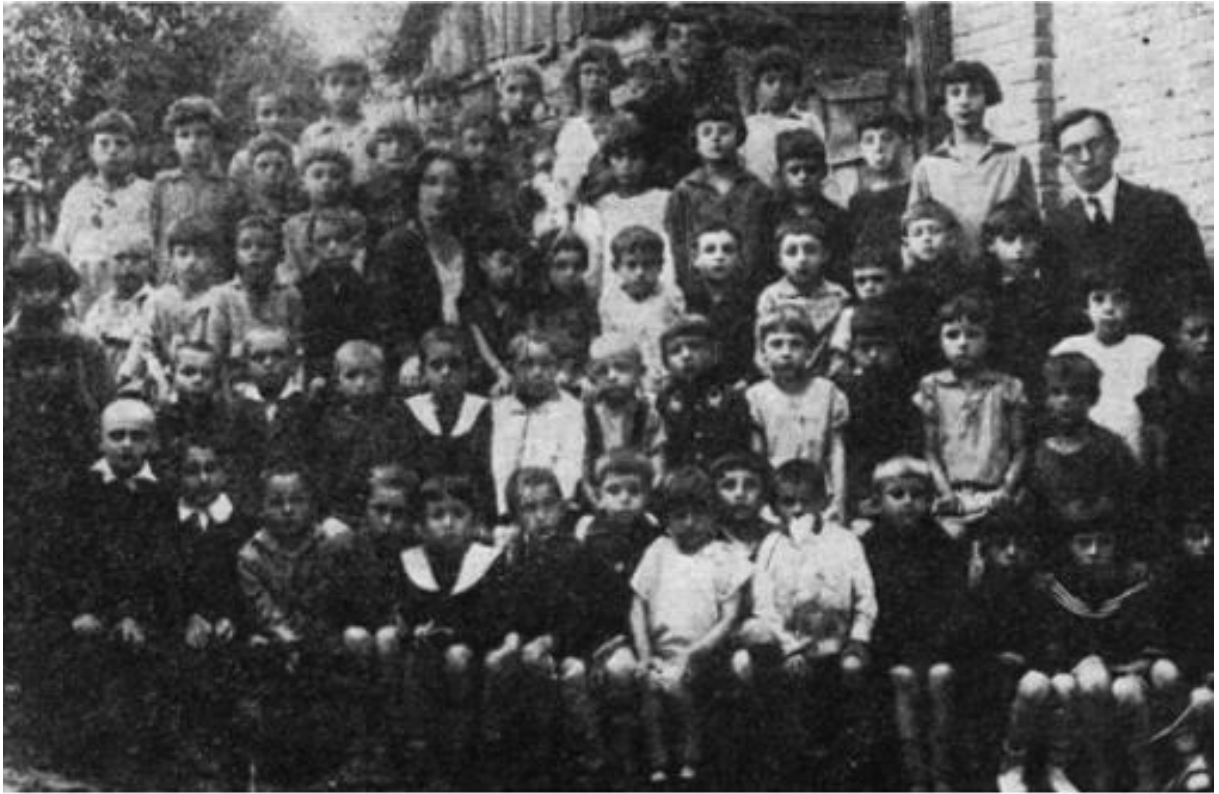
Учні школи їдиш. Дубровиця, 1930 р. 93