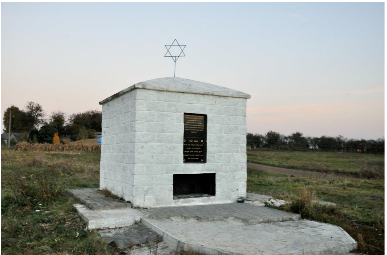
Пам'ятний знак на місці розстрілу єврейського населення, с. Великі Межирічі, урочище «Цегельня». 51

Невдовзі після проведення другої «Операції» в Межиріччі було створено гетто, куди переселяли євреїв із навколишніх сіл. 26 вересня 1942 р. гетто було ліквідовано. У цей день було розстріляно близько 1500 євреїв.