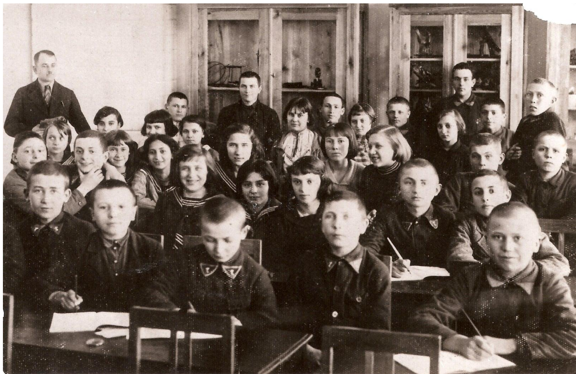
м. Березне, учні єврейського класу.1938 р.

Працювала бібліотека Тарбуту, яка надавала головним чином доступ до книг на івриті, однак не цуралась і тих, що були на їдиш. Ролі бібліотекарів виконували Гендлер, світлої пам'яті Шмуель Тойльман та інші, і робили це цілком безкорисливо.