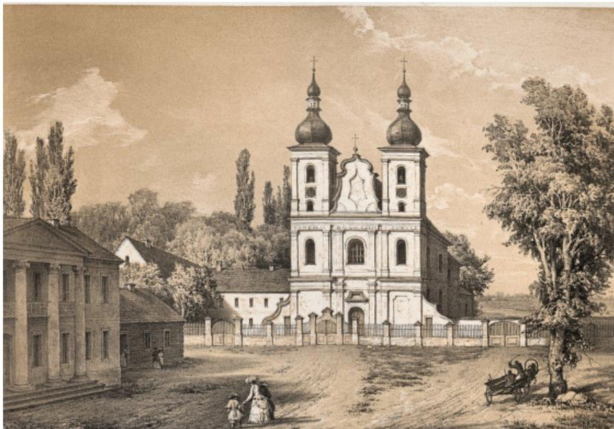
Домбровиця, 1875 р. 81

Історія самого міста, як засвідчує перша згадка про Дубровицю (варто зауважити, що не заснування, а перша писемна згадка) розпочалася з 1005 р., коли Володимир Великий започаткував єпископську кафедру в Турові. В переліку міст, які б мали належати до єпископії, є Дубровиця: «... третіє богомоліє єпископи постави(хъ) въ Турове въ льто 6513 (1005) и придахъ къ ней городивъ погостиъ въ послушаніє и священіє и благословеніє держати себъ туровской єпископїи: Пинскъ, Новгородъ, Городень, Берестье, Волковицькъ, Здитовъ, Неблестепенъ, Дубровица, Виьсочко, Случескъ, Колись, Ляховъ, Городокъ, Смиьдань, и поставихъ перваго єпископа Оьому,