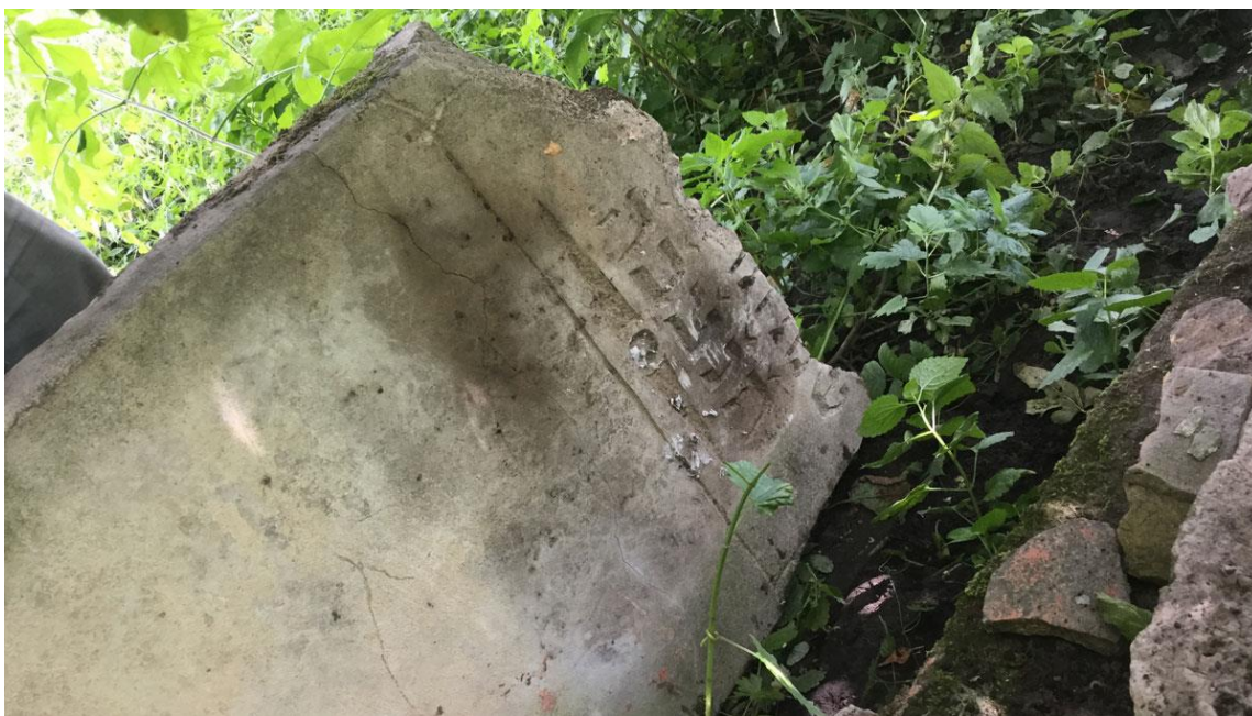
Боремель, мацева на єврейському цвинтарі. 2019 р. 34

Знищення єврейської громади в Боремелі відбулося на 22 вересня 1942 р., за містом, на березі річки Стир. Під час операції знищення співробітники СД, жандармерії розстріляли близько 700 осіб 33 . У наступні дні ще кілька десятків людей було вбито, які ховалися в місті та прилеглих селах. Кілька десятків євреїв змогли уникнути розправи і переховувались у лісах до відходу німців.