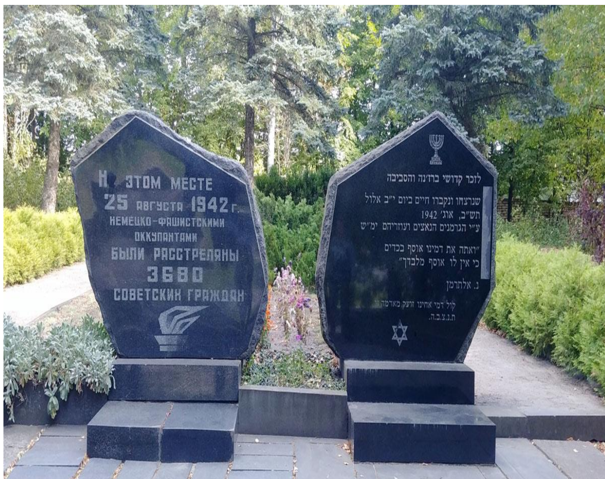
Березне, братська могила. 2019 р. 24

Наприкінці 1960-х рр. на місці розстрілу євреїв у Березному почали знаходити викопані людські рештки. З'ясувалось, що це – робота рук мародерів, які шукали єврейські цінності. Щоб припинити варварство, було вирішено на місці захоронення розбити дендрологічний парк. В кінці 80-х рр. тут було встановлено пам'ятний знак.