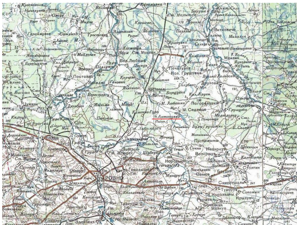
Антонівка на карті Червоної Армії 1941 року.

Антонівка — село, центр Антонівської сільської громади Вараського району Рівненської області.