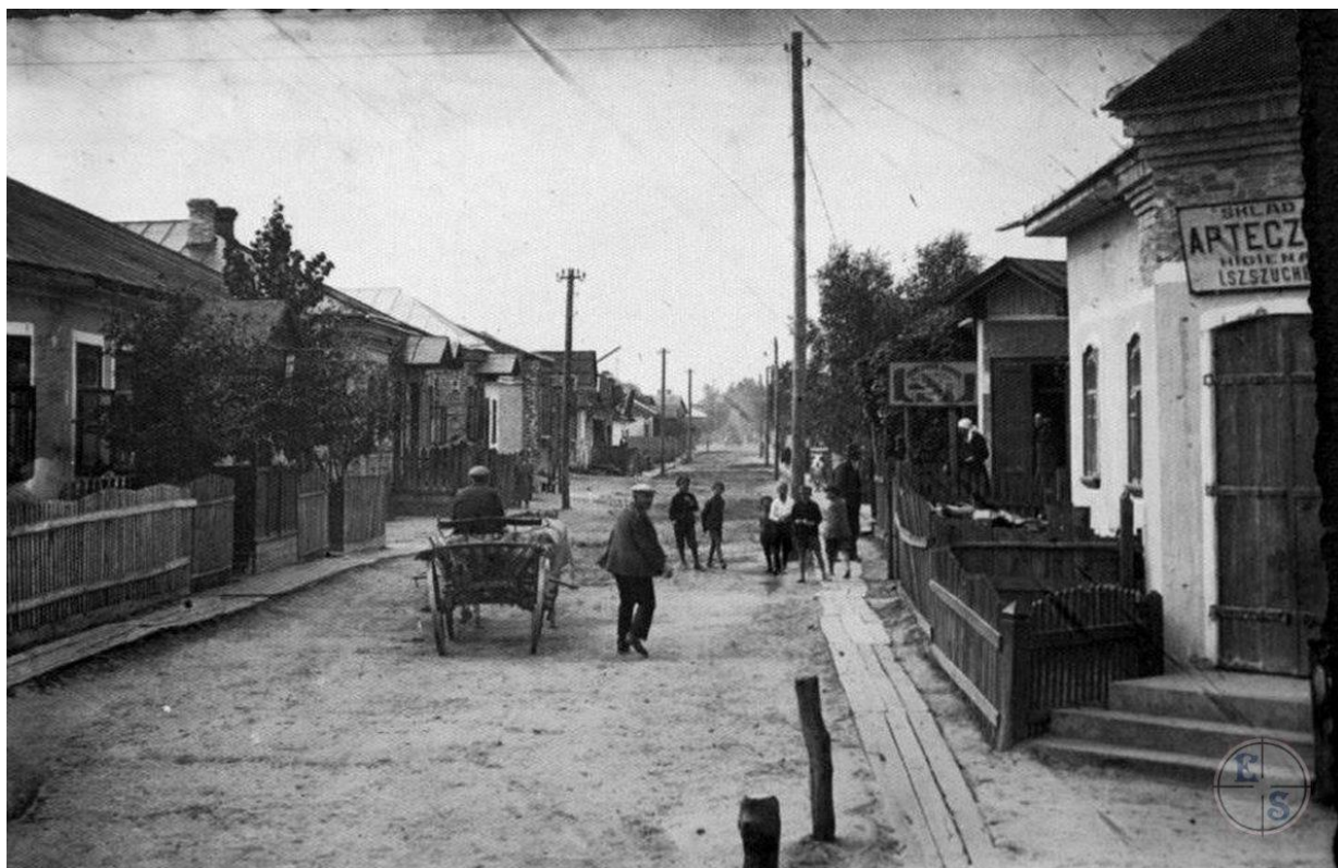
Березне, 1930 р. 16

З пуском у вересні 1885 року Поліської залізниці, що зв'язала Рівне з містом Лунінцем, водний шлях по Случі втратив колишнє значення основного транспортного засобу. Березне опинилося порівняно далеко від залізниці, перестало бути торговельним центром, що призвело до його економічного занепаду.