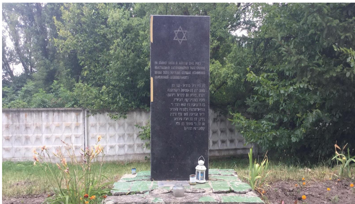
Пам'ятник жертвам Голокосту на братській могилі. Демидівка, 2019 р. 68

«Згідно свідчень свідків, комісія встановила, що в жовтні 1942 року за наказом командира А. було розстріляно з автоматів і пістолетів 600 євреїв. Тіла кидали одне на одне в яму, яку задалегідь викопали, а потім засипали тонким шаром землі. [...] Могила № 5 розміром 5x7м знаходиться в селі Демидівка. За наказом міліціонера К. там було розстріляно 50 євреїв Демидівського гетто. Тіла були виявлені з кулями в головах, зі зламаними руками і ногами. За словами селян, німецькі кати зібрали з села 50 молодих людей і закатували їх. Вішали за ноги на стовп і залишали на 15-20 годин зі зв'язаними руками і ногами. Молодих дівчат гвалтували, а потім убивали» 67 .