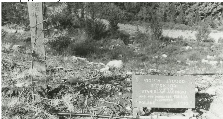
Памятний знак на честь Станіслава Ясінського та Емілії Сłodковської. Яд Вашем.

Після смерті батька Емілія Сłodковська емігрувала до Сполучених Штатів, і через багато років, коли Шмуелю вдалося знайти її, вони почали регулярно листуватися. 28 лютого 1985 року Яд Вашем визнав Станіслава Ясінського та його доньку Емілію Сłodковську, уроджену Ясінську Праведниками народів світу.