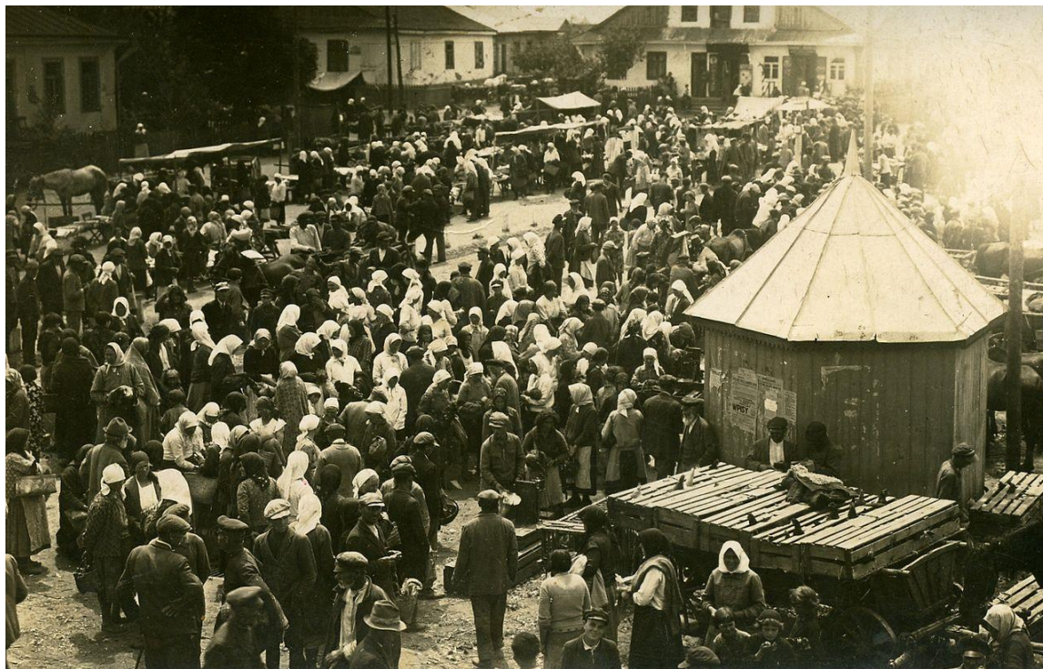
Боремель, ярмарок. 1939 р. 28

У XVI – XVII ст. Боремель був значним торгово-ремісничим центром. Про це свідчить той факт, що у 1547 році Боремелю було надано Магдебургське право.