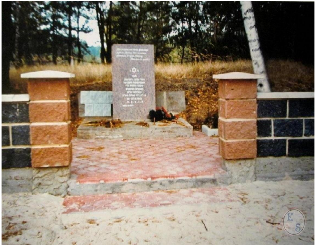
Братська могила. Дубровиця, 2002 рік.

Цей документ став останнім написаним ним у житті. Далі — майже три місяці очікування в рівненській тюрмі, неподалік від тих місць, де минула найбухливіша частина життя Хаїма Сигала, він же Кирило Сиголєнко, він же Карл Ковальський. 19 червня 1952 року вирок виконано, маскарад завершено. У 1996 році справу Хаїма Сигала переглядав слідчий СБУ — з метою можливої реабілітації засудженого. Прочитане в чотиритомній справі змусило залишити вирок у силі.