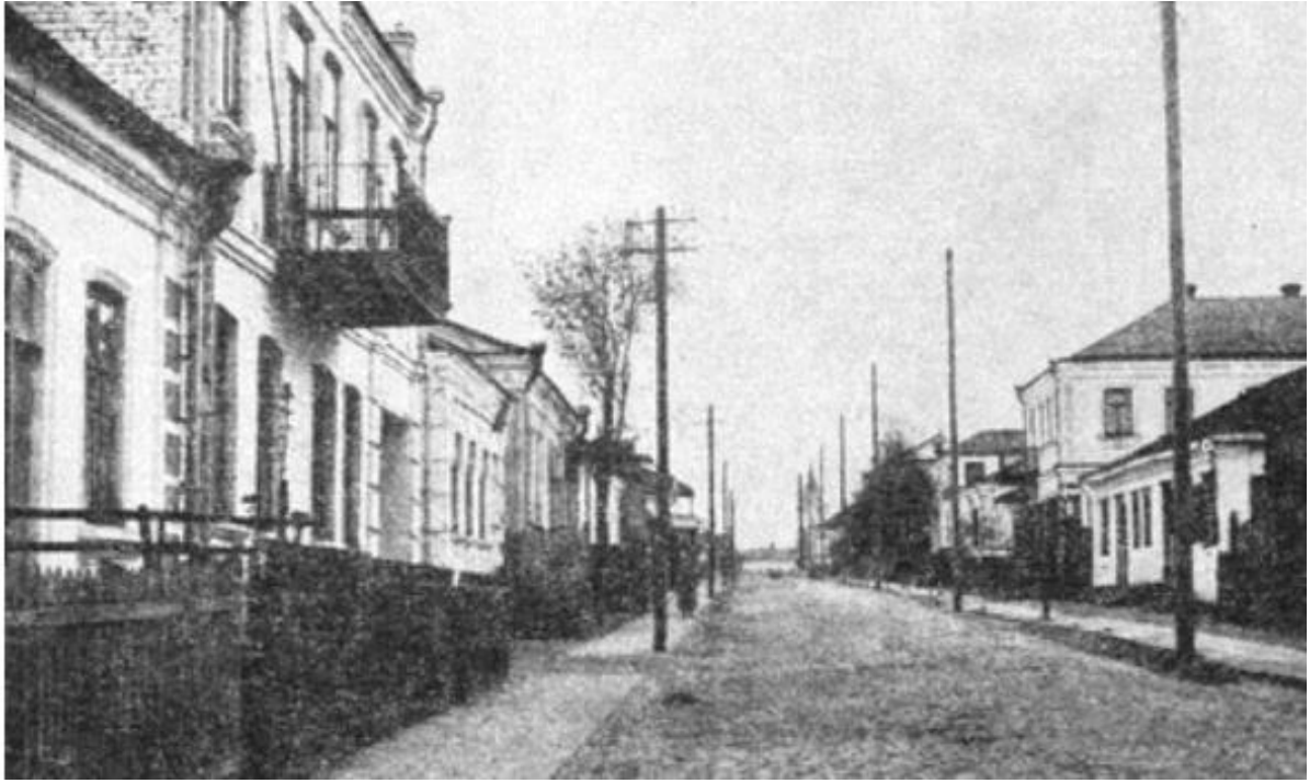
Дубровиця, вул. Третього Мая. 87