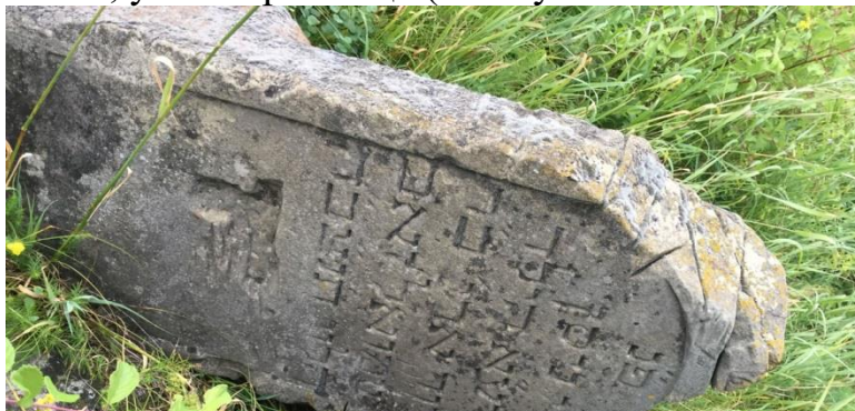
Мацева на єврейському цвинтарі

У 1913 році євреям належав дров'яний склад, обидві медоварні, обидва млини, усі 29 крамниць (в тому числі 19 бакалійних).