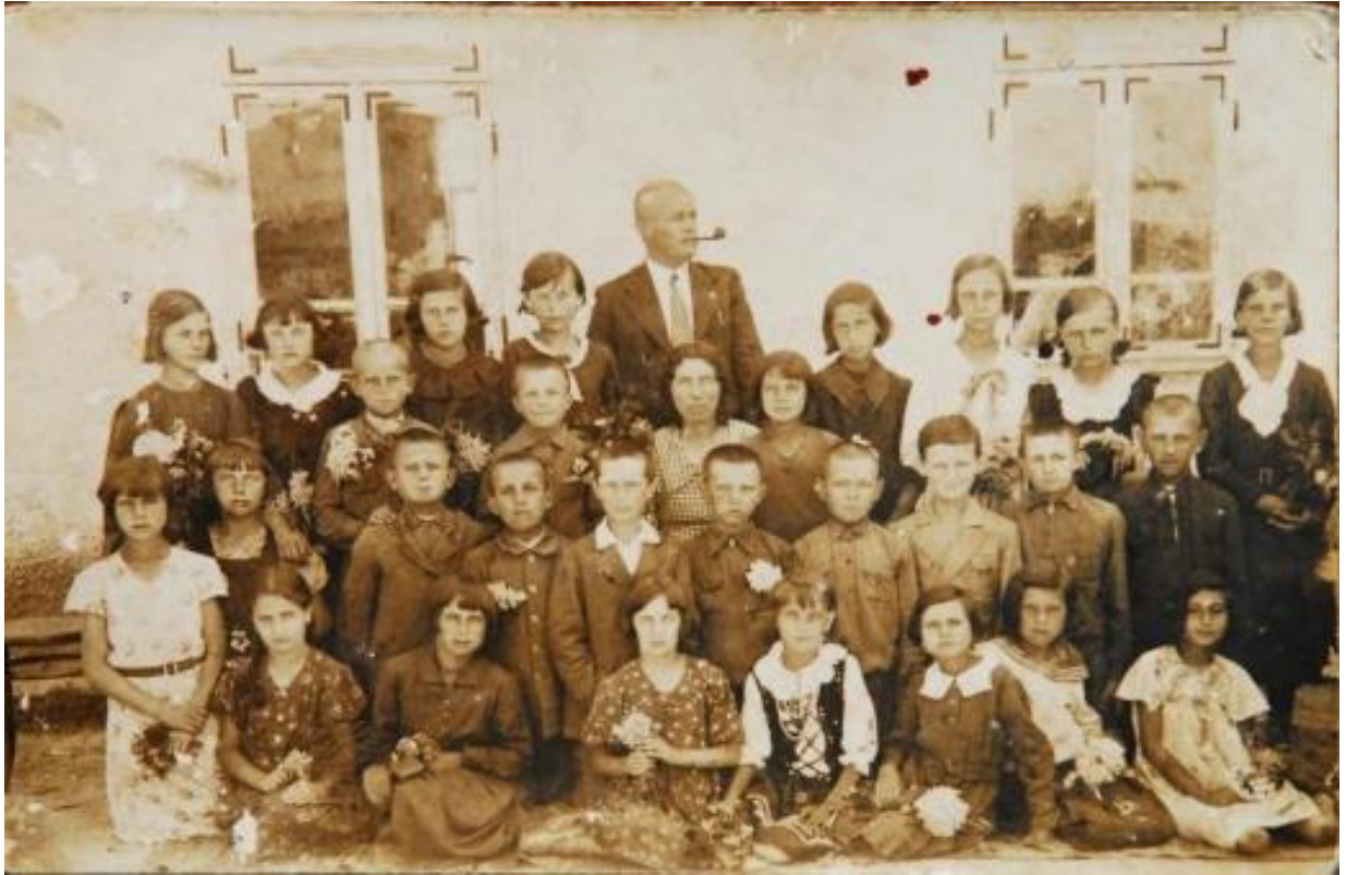
Єврейські діти в Демидівці перед Другою світовою війною. 63