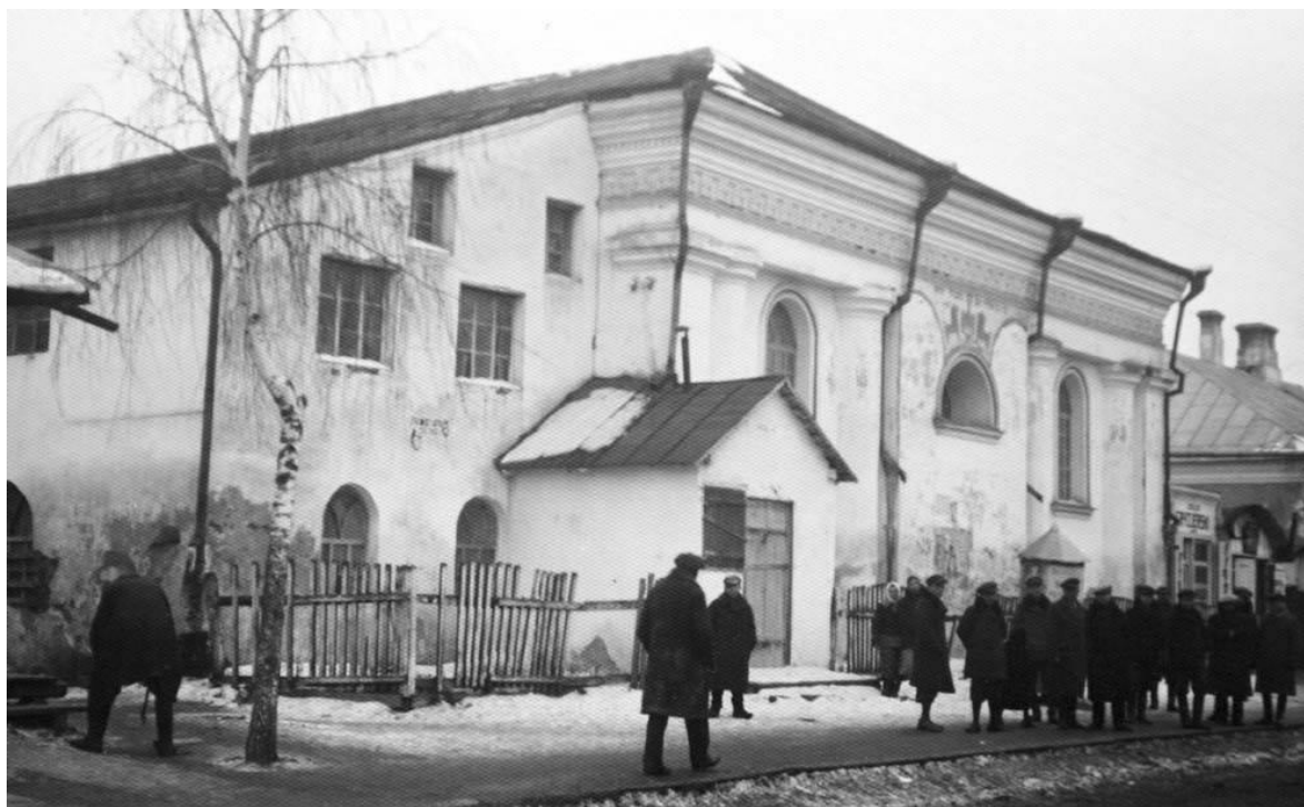
Березне, синагога. 1920 р. 19

мідраш стікалися євреї усіх соціальних верств, щоб взяти участь у читанні пообідніх та вечірніх молитов (мінха і маарів), а крім того інші – прихильники мітнагдїм і хасиди зі Століна. Також то був бейт мідраш казнодіїв. Функціонували Бейт мідраш столярів, синагога кравців, синагога бейт Абрахам. Миньян збирався в так званім Новим місті. У святкові дні сіоністи творили окремиї миньян, де збиралися пожертвування на різні цілі.