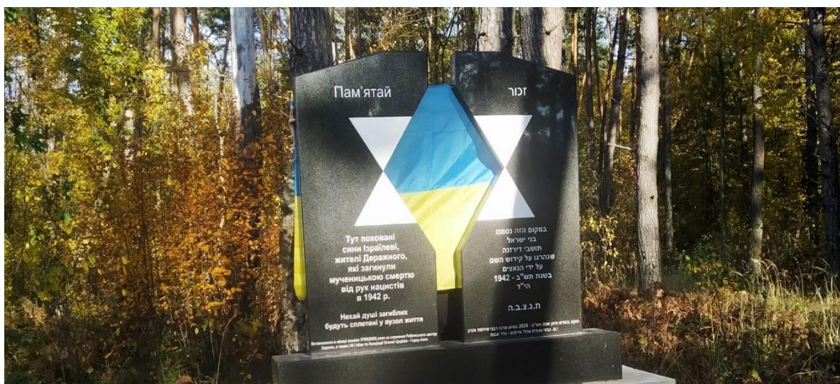
Братська могила в Бечальському лісі, 2023 р. 79

Коли вбивства закінчилися, братські могили засипали землею, а німці кілька разів розрівняли це місце машиною.