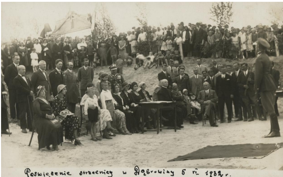
Освячення стрільбища в Дубровиці 5 червня 1932 року. 84

Є інші літописні згадки про місто: у 1184 році дубровицький князь Гліб Юрійович брав участь у переможному поході князя Святослава Всеволодовича на половців. З контексту літописної звістки випливає, що Дубровиця була стольним градом невеликого удільного князівства. Густинський літопис зберіг ім'я іншого дубровицького князя, Олександра, який у 1223 році разом із тисячами русичів загинув у бою на річці Калці 83 .