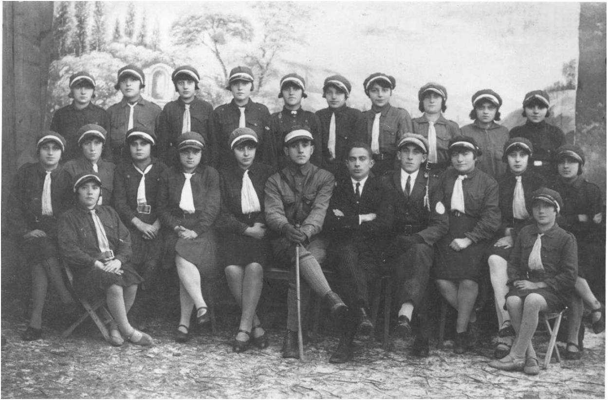
Варковичі, єврейські активісти з батальйону Бейтар.1936 рік. 40

Напередодні Другої світової війни у Варковичах проживало понад 1200 євреїв, у тому числі біженці з Польщі.