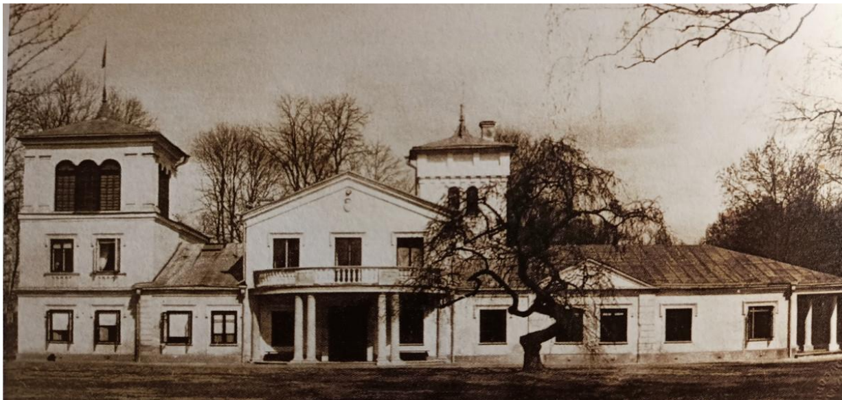
Палац Потоцького в Деражному. 1920-1939 рр. 70

Деражне — село в Рівненському районі, центр Деражненської сільської громади.