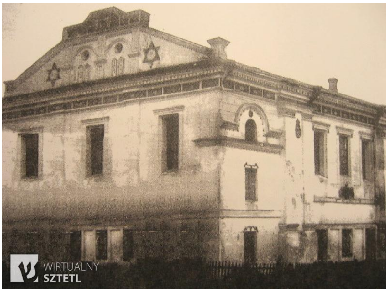
Межиріч Корецький, Велика синагога. 1933 р. 48

З 6 липня 1941 року до 15 січня 1944 року — під німецькою окупацією; упродовж 1944—1991 рр. — в Українській РСР.