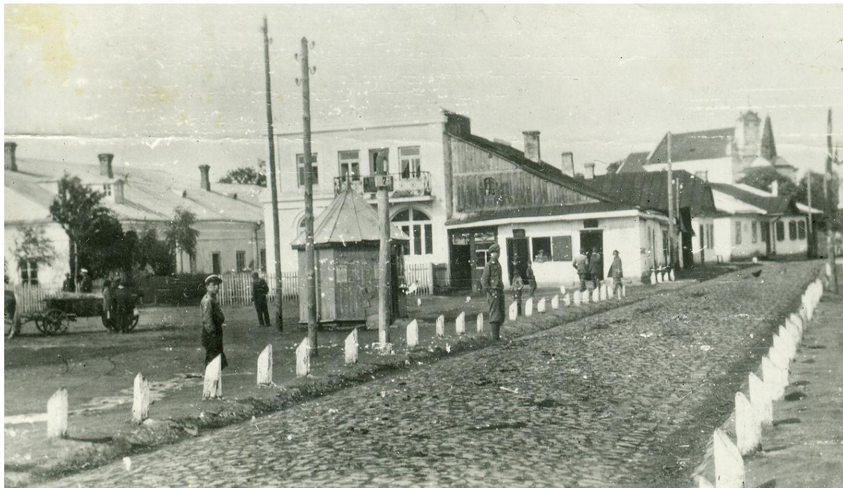
Центральна вулиця Боремеля. 1938 р. 26

Перша письмова згадка припадає на 1100 рік, коли у місті В'ятичеві зібралися руські князі, щоб покарати князя Давида Ігоровича, який порушив постанови Любецького з'їзду 1097 року. Покаранням Давиду Ігоровичу було те, що у нього забрали Володимирівське князівство, а взамін дали міста Остріг, Дубно, Заславль, Чорторийськ і Боремель.