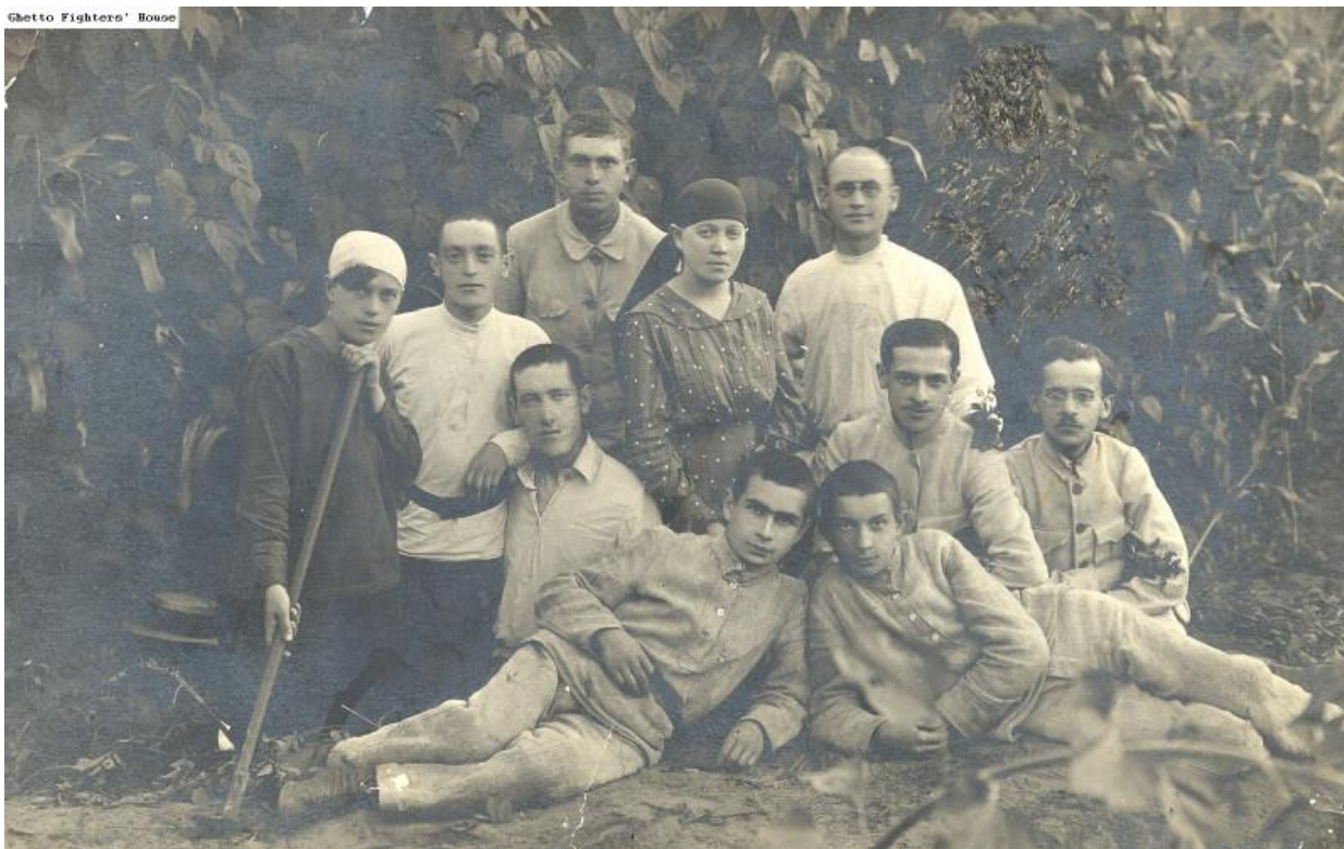
Дубровиця, члени єврейського молодіжного руху «Гехалуц». 1919 р. 89

єврейський дитячих садок, єшива та місцеві осередки єврейських товариств і партій.