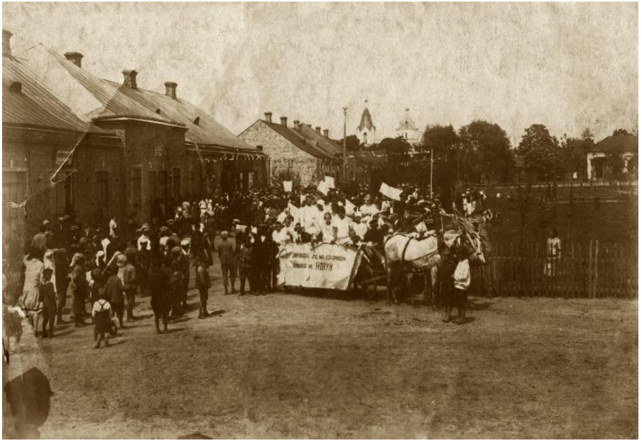
Дубровиця, центр міста (зараз – майдан Злагоди), 20-30 роки ХХ ст, напис на плакаті: «Записуйся в члени кооперативу ГОРИНЬ» (польською). 86

З 1777 р. повноправними господарями Дубровицького маєтку стали Плятери, які незмінно до 1918 р. володіли ним у різних родинних особах.