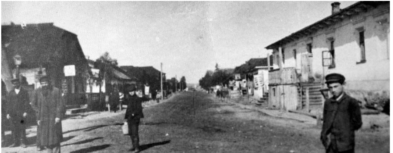
м. Березне, єврейський квартал. 30-і рр. ХХ ст. 20