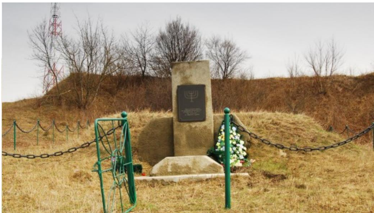
Пам'ятник на місці розстрілу понад 2500 євреїв з Варковичів та Озерян. (Тоді це був піщаний кар'єр). 45