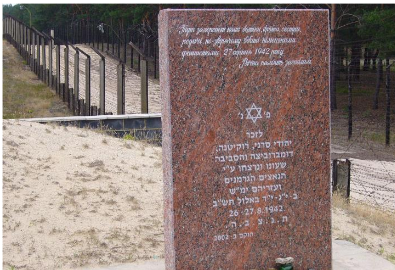
Пам'ятний знак у Тутовицькому лісі. 2002 р.

Влітку та восени 1941 року німці запровадили в Бережниці низку антиєврейських постанов. Євреям було наказано носити відмітні знаки у вигляді зірки Давида (пізніше її замінили на жовте коло); вони повинні були позначити свої будинки шестикутною синьою зіркою; їм було заборонено залишати місто; всі євреї віком від 14 років повинні були виконувати важку фізичну працю.