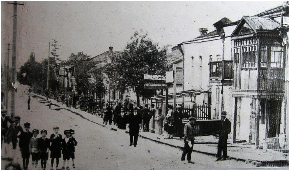
Центральна вулиця Березного, 1928 р. 15

Березне (у минулому також Андріїв) — місто, центр Березнівської міської громади Рівненського району.