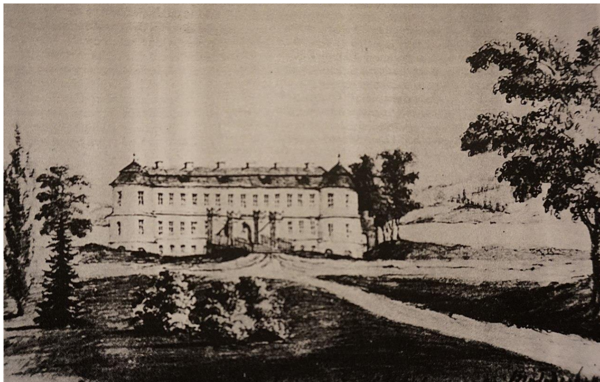
Палац у Варковичах. Зруйнований під час Першої світової війни. 36

Варковичі — центр Варковицької сільської громади Дубенського району.